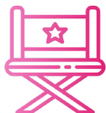
Grafico di redazione Art director Pubblicitario

Il diploma Grafica e comunicazione fornisce le competenze adeguate per diventare: